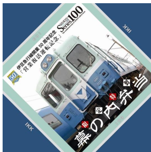
ツアー参加特典の「乗車記念プレート(左)」と「記念弁当の掛け紙(右)」 ※「記念弁当の掛け紙(右)」はイメージです