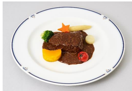
▲メイン料理のイメージ ※コース内容は変更となる場合がございます。